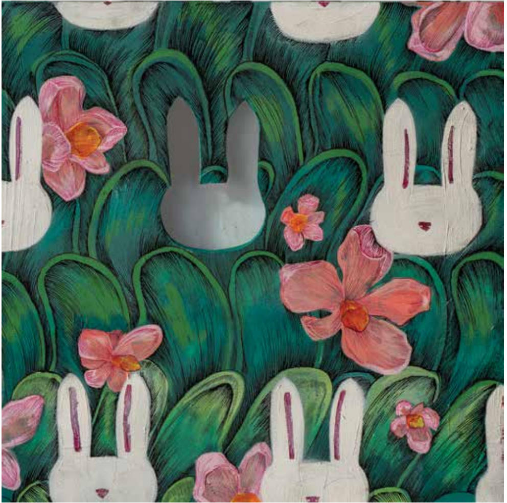
50x50 cm, Nice shot 2 – One of many (2018.)