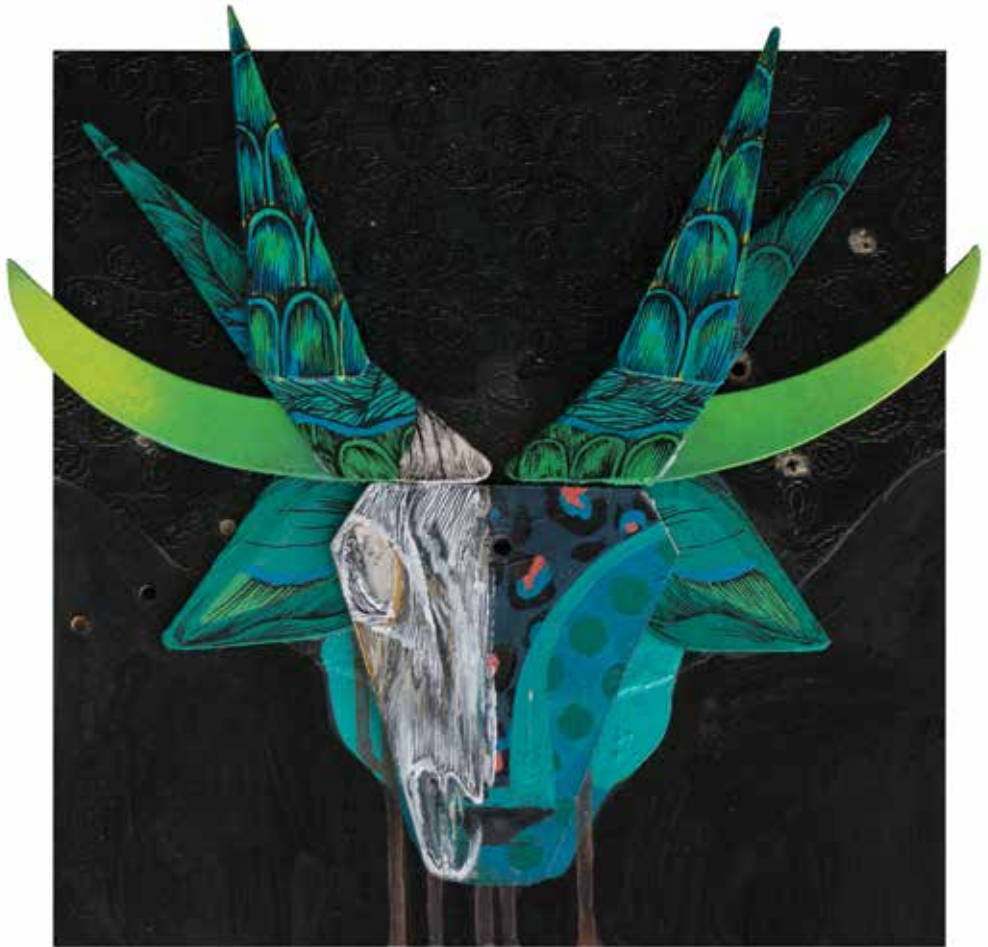
30x30 cm Petting zoo (2018.)