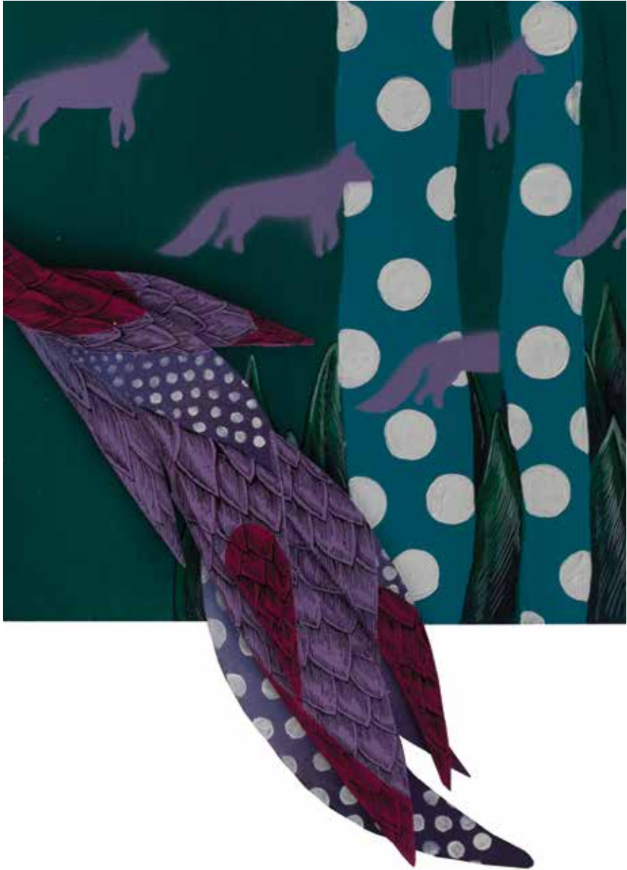
30x30 cm Accessory (2018.)