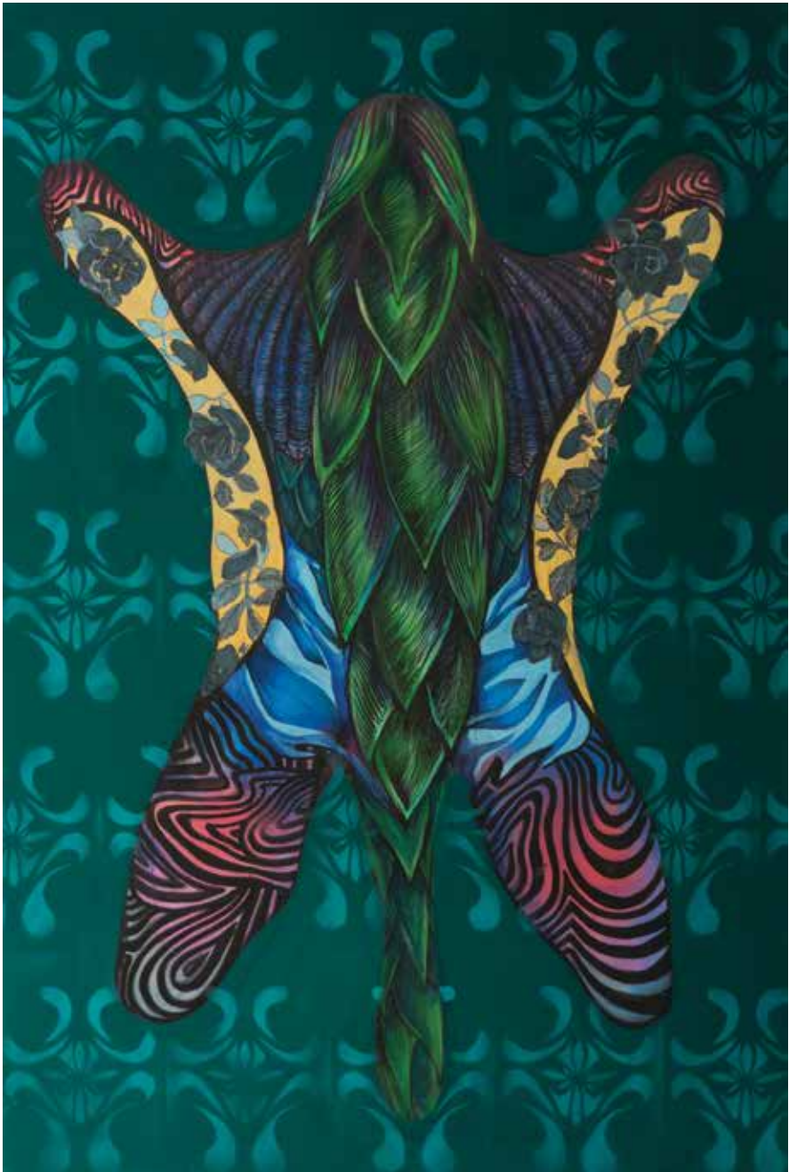
150x100 cm Nice shot 6 – The bold one (2018.)