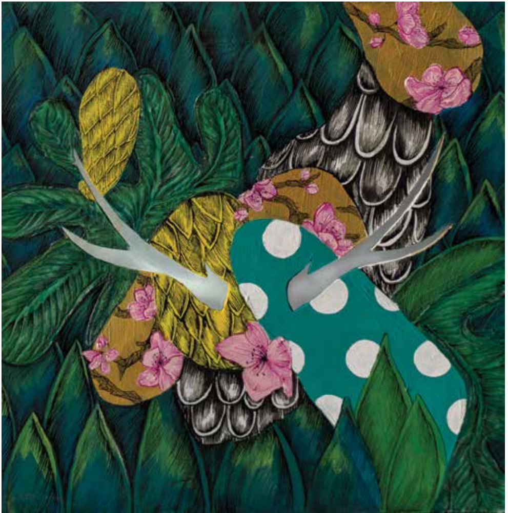
50x50 cm, Nice shot – The beautiful one (2018.)