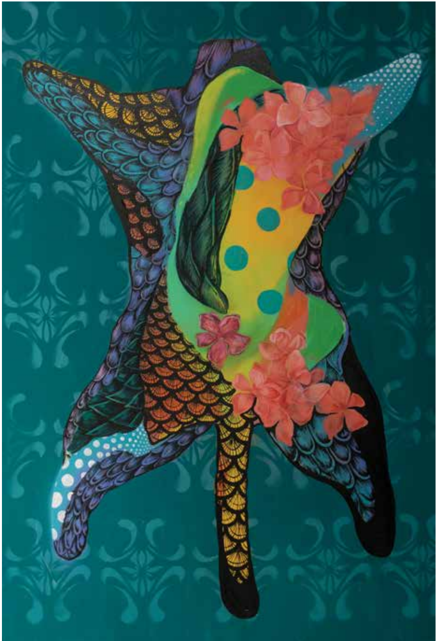
150x100 cm Nice shot 5 – The leading one (2018.)