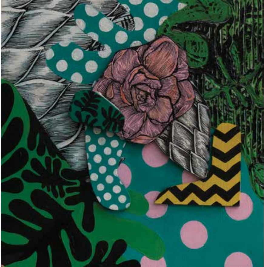
30x30cm No trespassing (2018.)