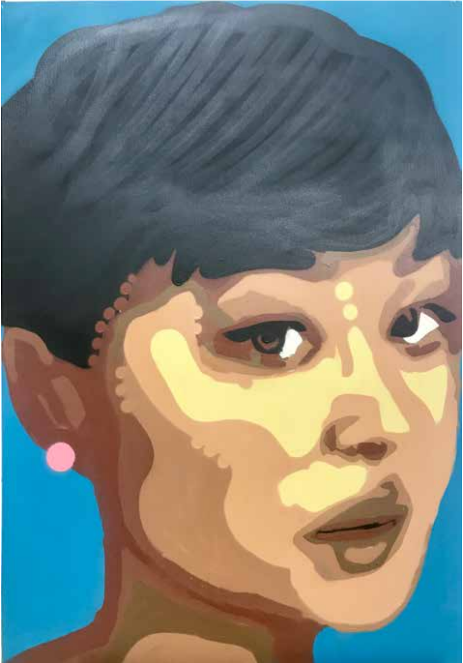
The Kraljica Vila aka TKV